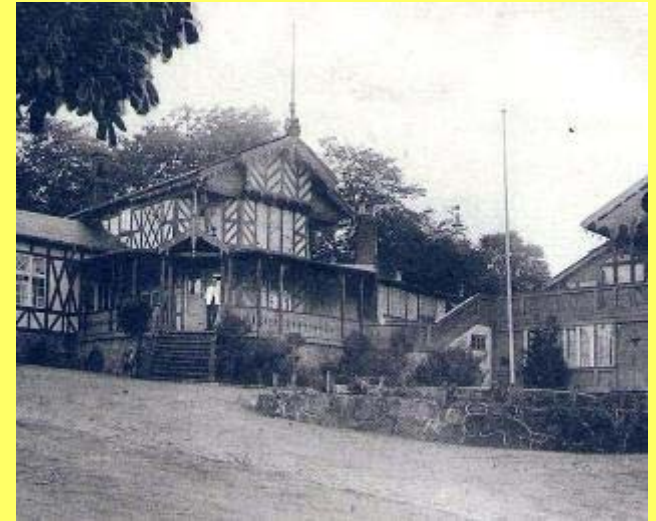
Forlystelsesstedet Alhambra var meget populært i 1930'erne.