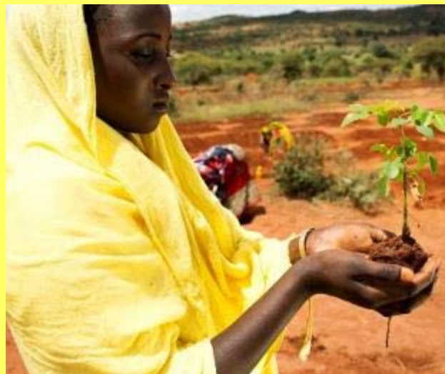
Folkekirkens Nødhjælp projekt i Medo village, Borena, Dhas district, Etiopien.

Man arbejder ud fra et kristent menneskesyn med respekt for ethvert menneskes rettigheder