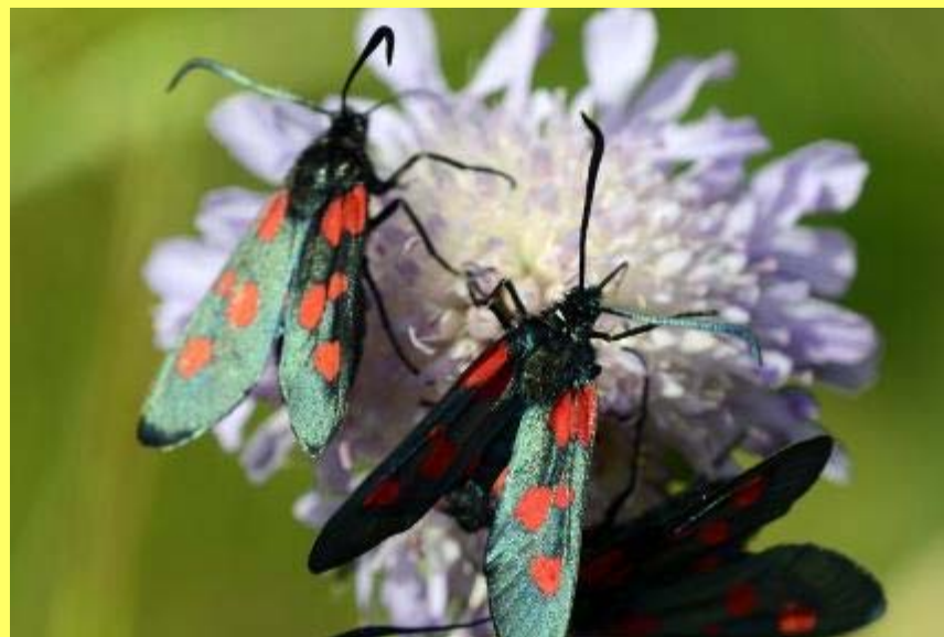
Den femplettede køllesværmer er en af de arter, der har risiko for at uddø i Danmark, men findes et par steder i Kolding Kommune

- Vi gennemgår alle de beskyttede naturarealer, og indberetter vores