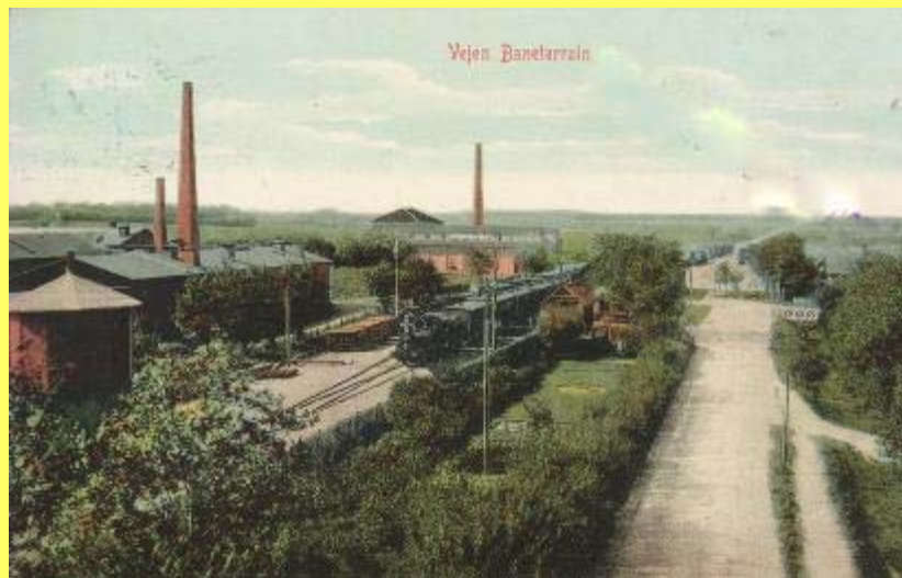
Vejen station på et gammelt postkort.

hun var. Rigtigt, det var kunstneren, som tegnede til Astrid Lindgrens bøger om Pippi Langstrømpe. Som ung gik hun på Kunstakademiet men droppede ud, da hun lod sig friste af andre tilbud. Herefter tilbragte hun længere perioder i Sverige, hvor hun blandt andet blev gift, skilt og fik en søn. I begyndelsen tjente hun penge