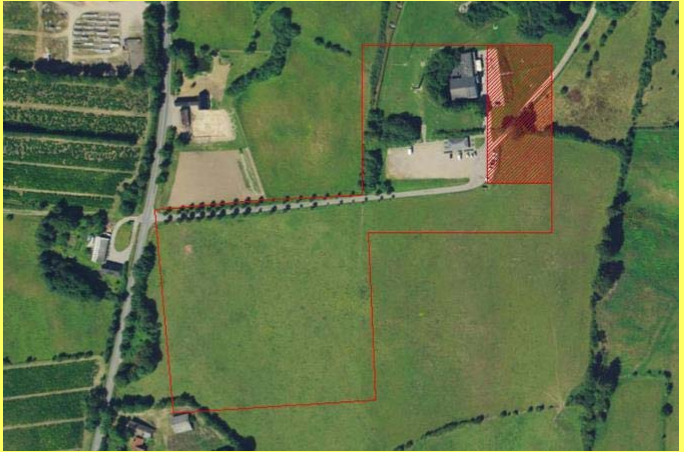
Det skraverede område viser byggefeltet på toppen af Skamlingsbanken. Byggefeltet fastsætter rammerne for, hvor besøgscentret kan opføres i den arkitektkonkurrence, som nu udskrives.

Det nye besøgscenter, som tidligst ventes at kunne indvies i forsommeren 2018, er et af elementerne i den ambitiøse fremtidssikring af Skamlingsbanken som national attraktion. Bag projektet står Skamlingsbankeselskabet, Fonden til bevarelsen af Klokkestablen samt Kolding Kommune. A.P. Møller Fonden har skænket 40 mio. kr. til projektet. Herudover er der skænket godt en halv mio. kr. fra Foreningen PlanDanmark til reovering af mindesmærkerne.