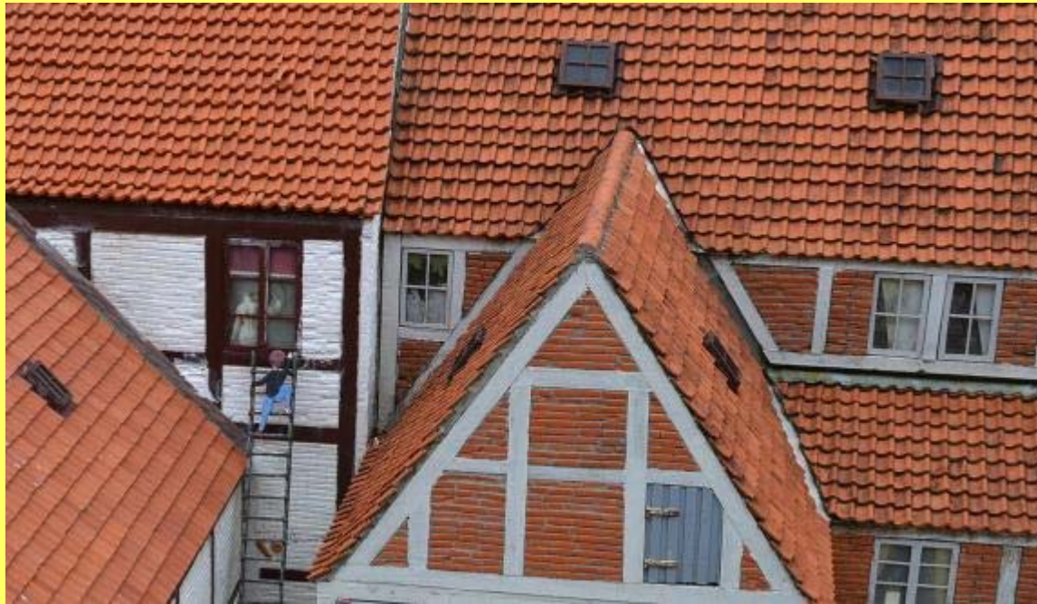
Her ses forsidebilledet i en lidt større udgave.