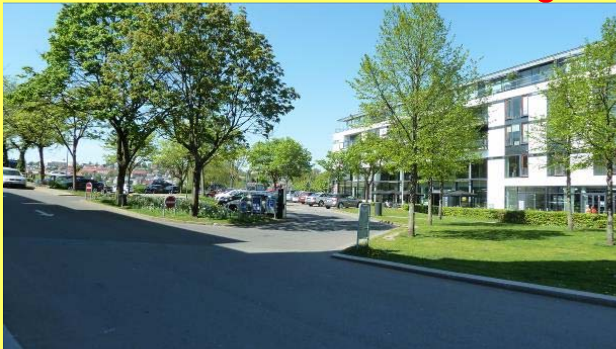
P-pladsen Sneglen bliver forvandlet til Biblioteksparken på Kulturnatten og i den efterfølgende kulturuge.

På Kulturnatten åbner en udstilling på biblioteket om en ny helhedsplan for Kolding midtby, som Plan- og Boligudvalget har sendt i høring. Samtidig bliver p-pladsen 'Sneg-