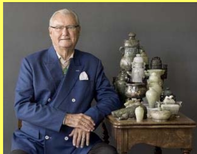
Hans Kongelige Højhed Prins Henriks private samling af orientalsk jadekunst udstilles på Koldinghus i 2017.

fascination af orientalsk jadekunst med publikum, der besøger udstillingen på Koldinghus. Samlingen er blevet til igennem mange år, og jeg ser frem til at se den i nye rammer på Museet på Koldinghus. Ikke bare er der mange minder og gode oplevelser knyttet til hver enkelt genstand, men jeg er også dybt fasci-