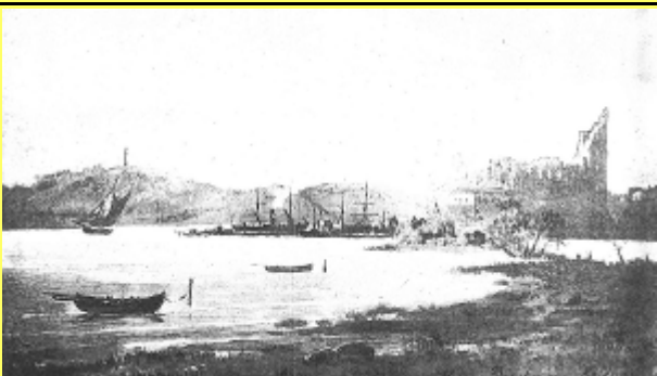
Kopi af en af Drachmanns skitser fra det gamle Koldinghus

- En af de ting, som har undret os i vores research-arbejde, er, at der er informationer om, at Holger Drachmann har siddet ved en bæk i/omkring det gamle Koldinghus, ikke bænken i Marielund, som det så ud på hans tid. - Der skulle han have lavet nogle skitser og malerier, men vi kan ikke finde dem. Vi har dog fundet et enkelt, og vi har også fundet nogle små skitser fra Marielund. De er sikkert lavet dernede. Vi har kun foto, vi har ikke origi-