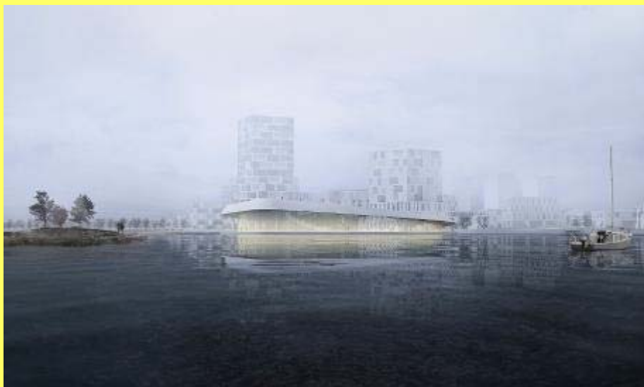
Fjordbadet, som det ser ud i udviklingsplanen for Marina City. Visualisering: COBE Arkitekter.

Mange kan huske, hvordan Kolding Fjord så ud for 50 år siden. Det var ikke et sted, man kunne bade uden at få diarré, og vandet lugtede ofte grimt. De sidste 10-20 år frem mod årtusindskiftet blev der sat kraftigt ind med spildevandsrensning. Og i de seneste 15 år har fokus været rettet mod at reducere den direkte udledning af spildevand i det åbne land til vandløb og søer. Næste skridt mod bedre vandkvalitet og renere badevand i fjorden