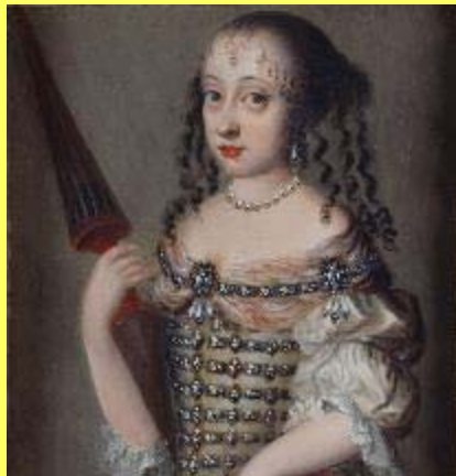
Den unge prinsesse Anna

August var, så vidt man vidste, en god lutheraner og var som sådan acceptabel for Christian 3., der jo selv var glødende protestant. Men i den sag var August tilsyneladende en filur, der lagde mere vægt på magt og indflydelse end på konfession. Efter rigsdagen i Augsburg i 1555, hvor det kom til en foreløbig fred mellem Europas ka-