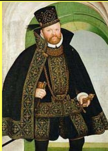
Hertug August af Sachsen

Til disse udvalgte skrev Christian 3. fra Koldinghus breve, hvori han ret detaljeret gjorde rede for, hvorledes de selv og deres ledsagende tjenere skulle være klædt, og han adviserede dem om, at de i Torgau vil blive bedt om at deltage i et dystløb, altså en god, gammel dags ridderturning. De skulle derfor, skrev kongen, medbringe brystharnisk, rygharnisk, hjelme og handsker til sig selv og tjenerne. De skulle også medtage heste. Otto Krumpen, der