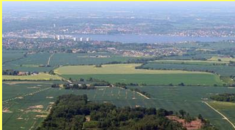
Kommuneplanforslaget skal blandt andet være med til at sikre en god trafikafvikling til og fra den sydlige del af Kolding.

Hvis vi skal tiltrække nye borgere til kommunen, er det helt afgørende, at vi kan tilbyde dem boliger og byggegrunde, og derfor er