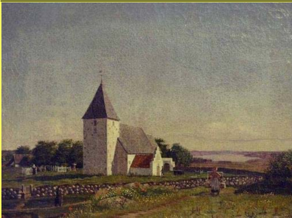
Peter Gemzøe: Seest kirke. 1839 (Nu i museet på Koldinghus)

dier, især sproglige (bl.a. skrev han en dansk synonymordbog) og juridiske.