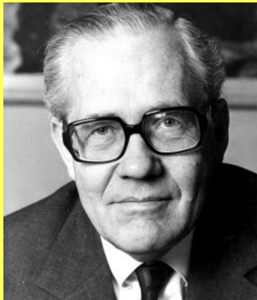
Poul Hartling blev valgt i Kolding

Og kaptajnen understregede hovmesterens betydning. Nok var han selv skibets vigtigste person, men hovmesteren var næsten lige så betydningsfuld, så der var en lønforskel på de to, idet kaptajnens årsløn var 1 kr. højere