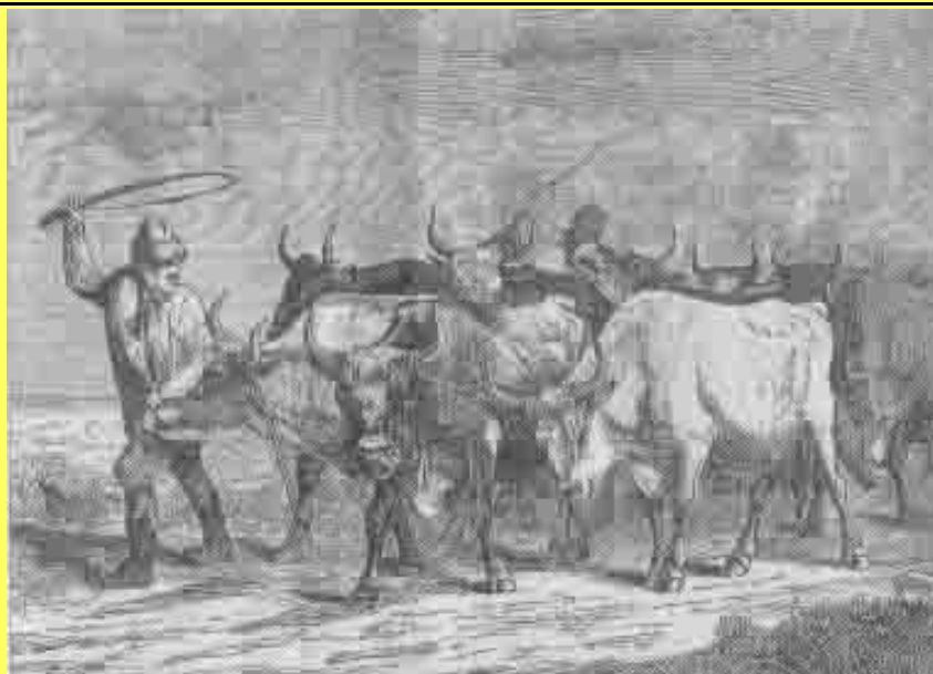
En studedrift fra begyndelsen af 1800-årene.

Hvor mange stude, der eksporteredes ulovligt, kan naturligvis ikke gøres op. Men mange var det. Dette afslørede ved en stor retssag i 1818.