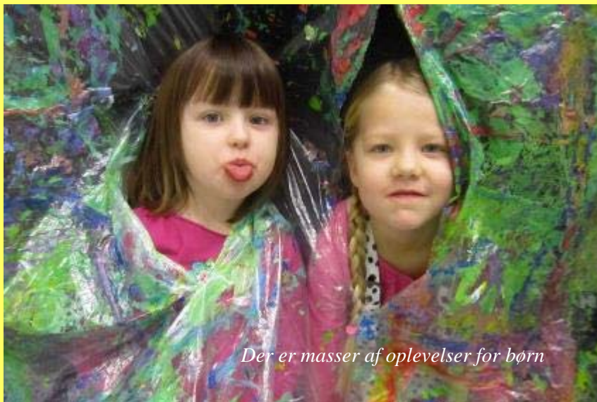
Der er masser af oplevelser for børn

andet skrald kan blive forvandlet til fantasifulde væsner og verdener, hvis vi ser på det med nye øjne. BEMÆRK - der er begrænsede pladser til arrangementet.