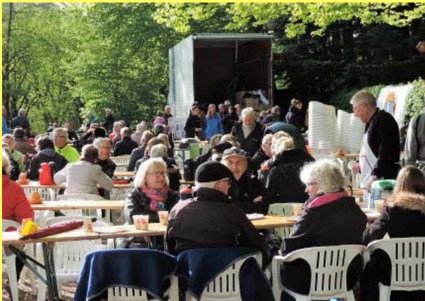
Et vue ud over de mange mennesker, der drak morgenkaffe pinsemorgen sidste år.

Udover morgenkaffe vil der være en tombola med masser af gode gevinster. Der plejer at være hurtigt udsolgt, så det om at sikre sig lodder tidligt på morgenen, hvis man vil skal have chancer for at vinde nogle af de lækre gevinster.