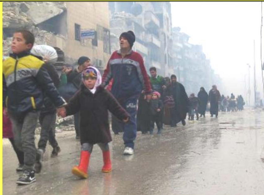
I Mellemøsten er der anvendt 93,6 mio. kr til katastrofearbejde.

I Asien blev 94,6 mio. kroner (20,8 %) brugt på fortsat genopbygning i