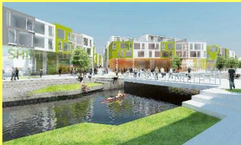
Holmstaden vil ligge i direkte tilknytning til gågaderne i Kolding.

Holmstaden, Koldings nye bydel med 59 outletbutikker og 100 boliger, har fået byggetilladelse og kan begynde byggeriet. Dermed er der taget et stort skridt mod etableringen af Holmstaden. Første fase består af 59 butikker, 8 restauranter/cafeer og godt 100 boliger. Butikkerne får fokus på mode, outdoor og interior design - alt til indretning af hjemmet. Holmstaden kommer til at huse brand stores, hvor de mest kendte mærker sælger varer til stærkt reducerede priser. Anden fase indeholder yderligere 40 butikker og flere boliger. Nordic Design Village, som er selskabet bag Holmstaden, har stillet garanti på 30 millioner kroner, der er en forudsætning for byggetilladelsen. "Byggetilladelsen og ikke mindst garantien bag den, er stort skridt frem mod realiseringen. Det er nu af vores hænder, men vi forventer