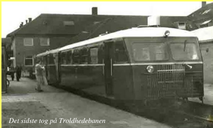
Det sidste tog på Trolldhedebanen

men først og fremmest transporteredes store mængder tørv og brunkul fra lejerne nær Trolldhede til Kolding. Trolldhedebanen har således dels haft stor betydning for opdyrkningen og landbruget i Midt- og Vestjylland, dels for landets energiforsyning i mellemkrigs- og krigsårene. Alligevel kørte også denne bane med betydelige underskud, hvorfor den lukkedes i 1968, bl.a. udkonkurreret af rutebiler til persontrafik.