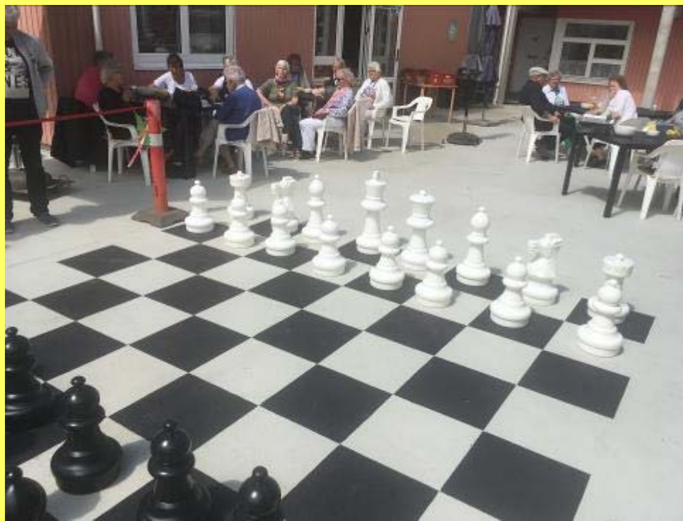
Det store skakspil på Midtgården.

opmærksom på alle de ting, I laver, og jeg håber for jer, at det vil betyde, at stadig flere får øjnene op for de mange muligheder, der er for at blive aktiveret, underholdt og komme i rigtig godt sel-