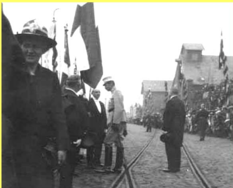
Kong Christian den 10. modtages her på Kolding Havn.

grænsen. Kongeparret ankom med kongeskibet til Kolding havn, hvorfra turen gik sydpå i biler indtil Taps, hvor kongen besteg en hvid hest og på den red sydpå og krydsede grænsen ved Frederikshøj.