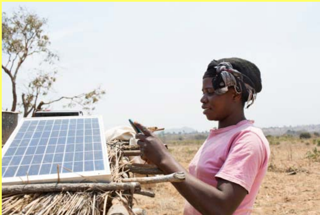
Et solpanel kan forandre en fattig families liv radikalt. Nu vil Folkekirkens Nødhjælp og M-PAYG teste, om man kan hjælpe flygtninge og tjene penge på det.

I Uganda er Folkekirkens Nødhjælps medarbejdere behjælpelige med at identificere potentielle