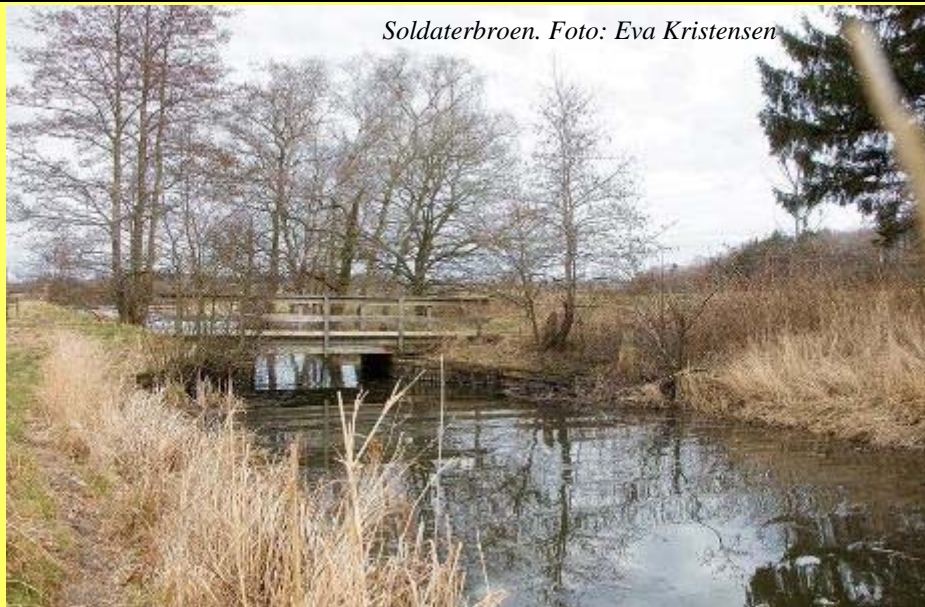
Soldaterbroen.