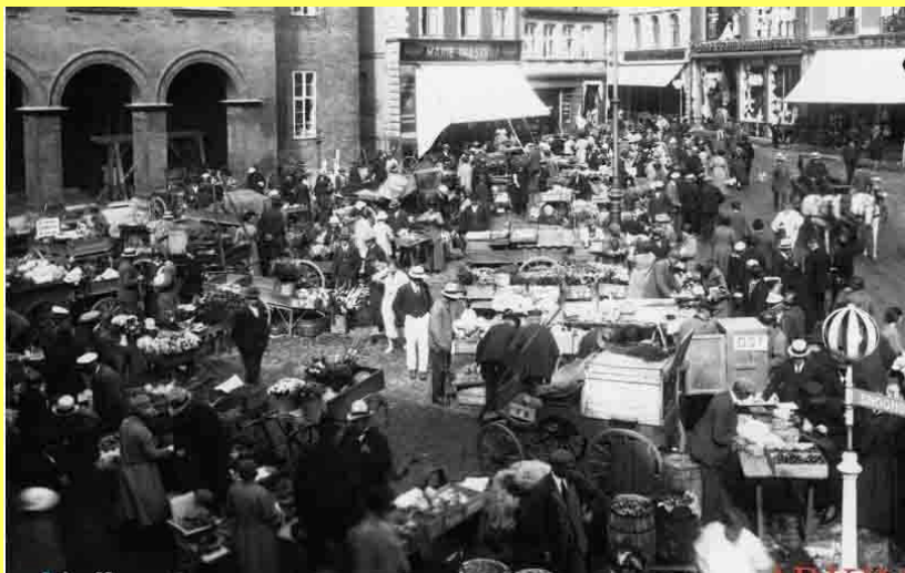
Torvedag i 1924.

I dagens Kolding er tirsdag stadig torvedag, på et tidspunkt er også fredag blevet torvedag.