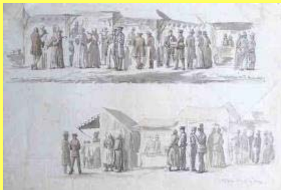
Torvedag i Kolding 1853, (laveret tegning af Ferdinand Richardt i Museet på Koldinghus)

marked (Mikkelsdag 29. september), som dog 1490 flyttedes til Skt. Franciskus dag, som er 4. oktober.